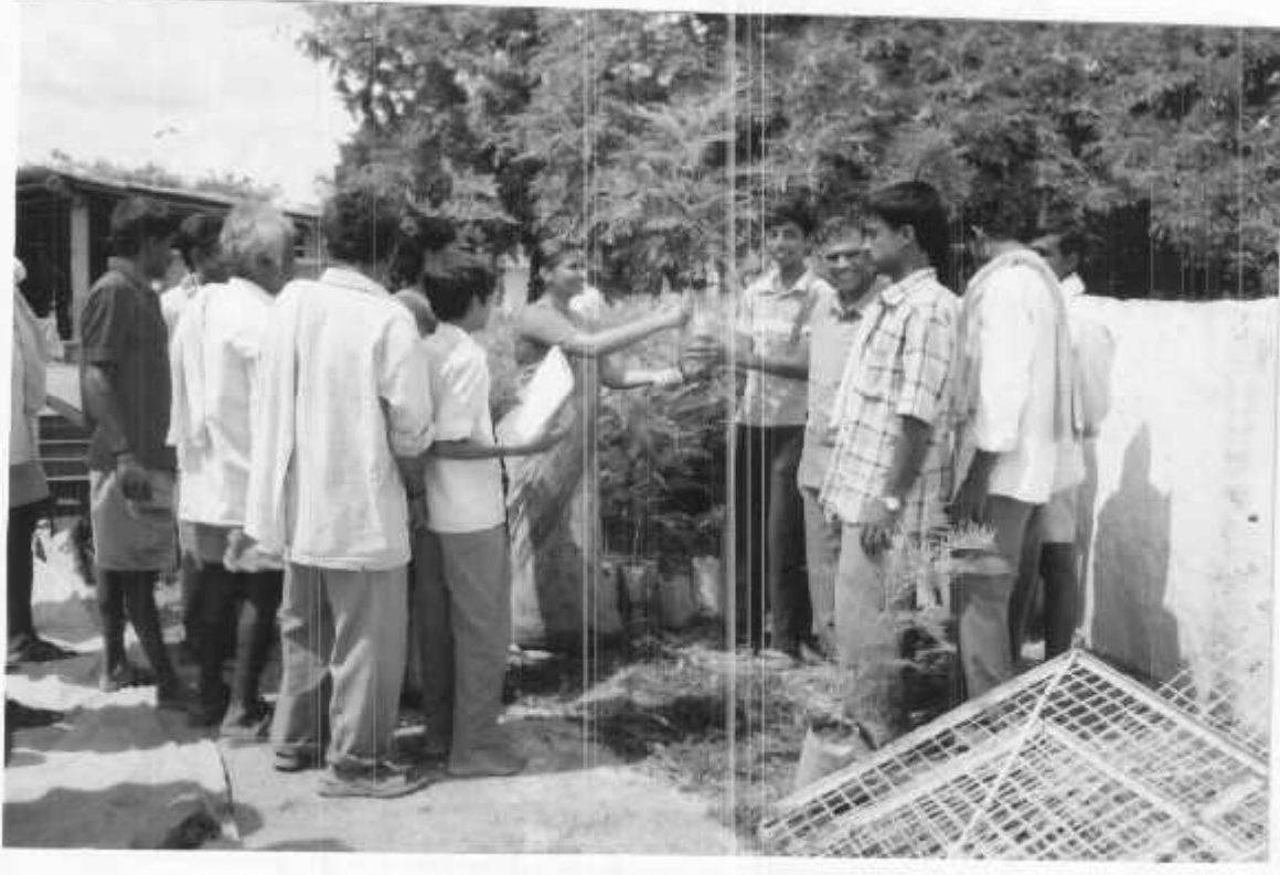
ಅರಣ್ಯ ಸಸಿಗಳ ವಿತರಣೆ