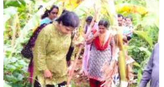
ಬಳಕೆದಾರರಿಗೆ ಸಾವಯವ ಕೃಷಿ ತೋಟಕ್ಕೆ ಭೇಟಿ

೨೦೦೪ ನೇ ಇಸವಿಯಿಂದ ಜನೋದಯ ಸಂಸ್ಥೆಯು, ರಾಸಾಯನಿಕ ಕೃಷಿ ಭೂಮಿಯನ್ನು ಸಾವಯವ ಕೃಷಿ ಭೂಮಿಯನ್ನಾಗಿ ಪರಿವರ್ತಿಸಿದ ಭೂಮಿಯಿಂದ ಸುಮಾರು ೩೫೦೦೦ ದಿಂದ ೪೦೦೦೦ ಕೆ, ಜಿಯೆಷ್ಟು ಸಾವಯವ ಉತ್ಪನ್ನಗಳಾದ ತರಕಾರಿ, ಹಣ್ಣು ಹಂಪಲುಗಳು ಹಾಗೂ ಧಾನ್ಯಗಳನ್ನು, ೨೩೨೫ ರೈತರಿಂದ, ೧೮೦೦ ಎಕರೆ ಜಮೀನಿನಿಂದ ಪ್ರತಿ ವರ್ಷ ಪಡೆದುಕೊಳ್ಳುತ್ತಿದ್ದು, ಈ ಉತ್ಪನ್ನಗಳನ್ನು ೩೫೦೦ ರಷ್ಟು ಬಳಕೆದಾರರಿಗೆ ಒದಗಿಸುವ ಸಲುವಾಗಿ, ಜನೋದಯ ಸಂಸ್ಥೆಯಿಂದ ಪರ್ಯಾಯ ಮಾರುಕಟ್ಟೆಯ ವ್ಯವಸ್ಥೆಯನ್ನು ಮಾಡಲಾಗಿದೆ.