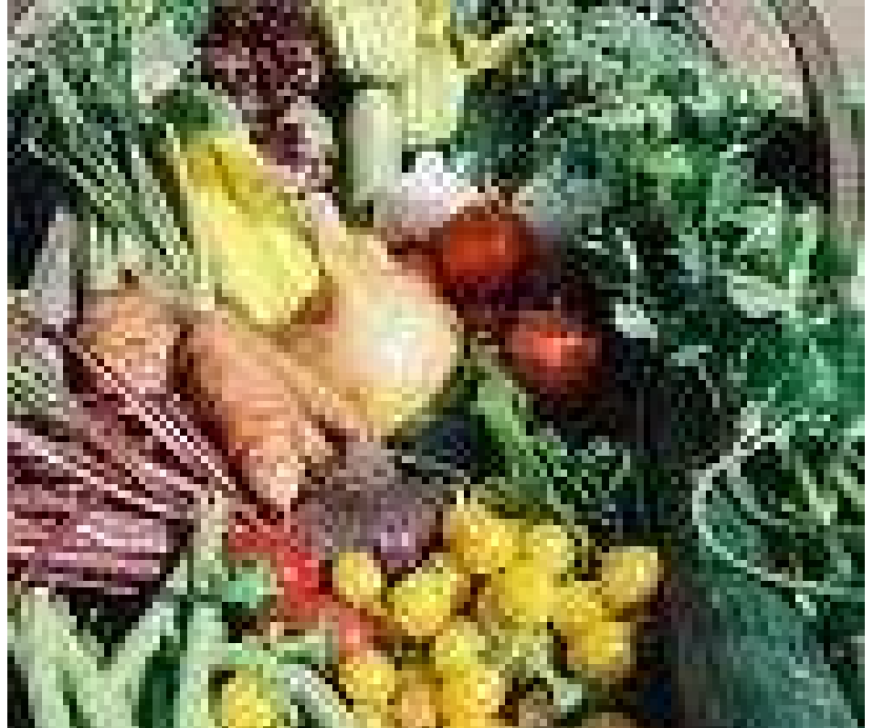
ಸಾವಯವ ಉತ್ಪನ್ನಗಳ ಒಂದು ದೃಶ್ಯ

ಸಾವಯವ ಕೃಷಿ ಉತ್ಪನ್ನಗಳನ್ನು ಹೆಚ್ಚಿಸಲು ಅಳವಡಿಸಬಹುದಾದ ವಿಧಾನಗಳು ಹಲವಾರು ಅವುಗಳಲ್ಲಿ ಮೊದಲನೆಯದು:-