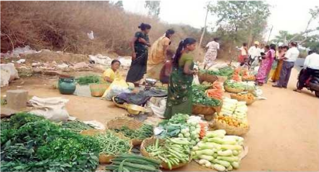
ರಾಜ್ಯ ಹೆದ್ದಾರಿಯಲ್ಲಿ ಸಾವಯವ ರೈತರ ಮಾರುಕಟ್ಟೆ

ರೈತರನ್ನು ತಮ್ಮ ಬಡತನದಿಂದ ಮುಕ್ತಿಗೊಳಿಸಲು ಮತ್ತು ಸಾವಯವ ಕೃಷಿ ಉತ್ಪಾದನೆಯಿಂದ, ಮಾರಾಟದಿಂದ ಹಾಗೂ ಉದ್ಯಮೀಕರಣದಿಂದ ತಮ್ಮ ಬಡತನದ ಸುಧಾರಣೆ, ಅಧೀಕ ಸಶಕ್ತೀಕರಣ ಹಾಗೂ ಬಳಕೆದಾರರನ್ನು ಅನಾಹುತಗಳಿಂದ ರಕ್ಷಿಸಿ, ವಿಷಕರ ಅಹಾರವನ್ನು ಒದಗಿಸಿ ಅವರ ಅರೋಗ್ಯವನ್ನು ಕಾಪಾಡುವಲ್ಲಿ ಹಾಗೂ ಭೂಮಿಯನ್ನು ರಕ್ಷಿಸುವ ಸಲುವಾಗಿ ಈ ಯೋಜನೆಯನ್ನು ಅಳವಡಿಸಲಾಗಿದೆ.