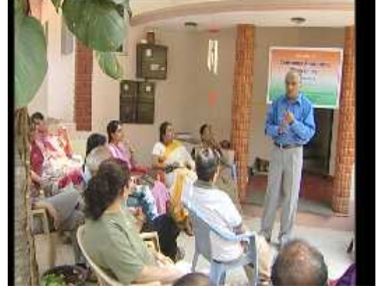
ಬಳಕೆದಾರರಿಗೆ ತಿಳುವಳಿಕಾ ಕಾರ್ಯಕ್ರಮ