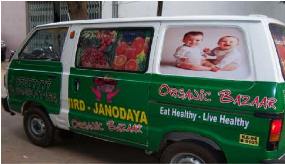
ಜನೋದಯ ಸಂಸ್ಥೆಯ ಸಾವಯವ ಸಂಚಾರಿ ವಾಹನ

೨೦೦೨-೦೮ ನೇ ವರ್ಷದಿಂದ ಉತ್ಪನ್ನ ಮತ್ತು ಬಳಕೆದಾರರ ಸಂಪರ್ಕ ಕೇಂದ್ರಗಳು ಹಾಗೂ ಉತ್ಪಾದನೆ ಮತ್ತು ಬೇಡಿಕೆಗಳನ್ನು ಗಮನಿಸಿ, ಅದಕ್ಕೆ ಸೂಕ್ತವಾದ ಕಾರ್ಯಕ್ರಮಗಳನ್ನು ನಿಯೋಜಿಸಲಾಯಿತು. ಈ ಯೋಜನೆಯಲ್ಲಿ ರೈತರ ಉತ್ಪಾದನೆಗಳನ್ನು ಅವರ ಹಳ್ಳಿಗಳಿಂದ, ಜನೋದಯ ಸಂಸ್ಥೆಯಿಂದ ಈ ಯೋಜನೆಗಿಂದೇ ಮೀಸಲಾದ ಸಂಚಾರಿ ವಾಹನದ ಮೂಲಕ ಉತ್ಪನ್ನಗಳನ್ನು ಪಡೆದುಕೊಂಡು, ಸಂಸ್ಥೆಯಿಂದ ವ್ಯವಸ್ಥಿಸಲ್ಪಟ್ಟ ೮ ಮಾರಾಟ ಕೇಂದ್ರಗಳ ಮುಖಾಂತರ ಹಾಗೂ ಮಾರಾಟ ಮಳಿಗೆಗಳು, ಸ್ವಯಂ ಸೇವಾ ಸಂಸ್ಥೆಗಳ ಸಂಪರ್ಕ ಕೇಂದ್ರಗಳ ಮುಖಾಂತರ ಮಾರಾಟ ಮಾಡಿ; ರೈತರಿಗೆ ತಮ್ಮ ಉತ್ಪನ್ನಗಳಿಗೆ ನ್ಯಾಯ ಬೆಲೆಯನ್ನು ದೊರಕಿಸಿಕೊಡಲಾಗುತ್ತಿದೆ. ಹಾಗೆಯೇ ಸಂಚಾರಿ ವಾಹನದ ಮೂಲಕ, ಅಪಾರ್ಟ್‌ಮೆಂಟ್‌ನಲ್ಲಿರುವ ಬಳಕೆದಾರರಿಗೆ ನೇರವಾಗಿ ಉತ್ಪನ್ನಗಳನ್ನು ಒದಗಿಸುವ ಯೋಜನೆಯನ್ನು ಪ್ರಾರಂಭಿಸಲಾಯಿತು.