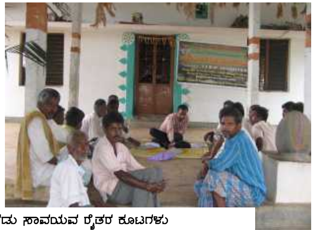
ಗೊರಿಬಿದನೂರು ತಾಲೂಕಿನಲ್ಲಿ ರಚಿಸಲಾದ ಎರಡು ಸಾವಯವ ರೈತರ ಕೂಟಗಳು

ಪ್ರಜಾಪೀಠದವರು, ಸರ್ಕಾರದವರು ಮತ್ತು ಸ್ವಯಂಸಹಾಯ ಸಂಘಗಳವರು ಮುಳಿಗೆಗಳಿಗೆ ವಾಹನದಲ್ಲಿ ಒದಗಿಸುವ ಮೂಲಕ ಉತ್ಪಾದಕರಿಗೆ ನ್ಯಾಯಬೆಲೆಯನ್ನು ದೊರಕಿಸಿಕೊಡುತ್ತಿದೆ.